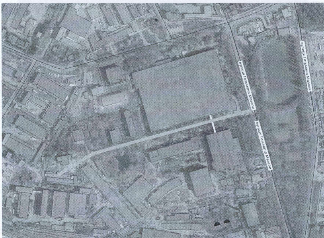
Пропонований проїзд Інтегральний (м. Вінниця)